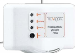
GD2R-220EC Извещатель токсичной концентрации угарного газа, 230 В, 2 уров. тревоги, электрохимический