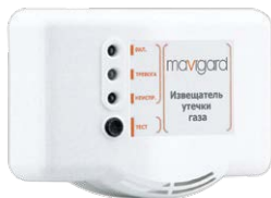
GD2R-220EC Mavigard Извещатель токсичной концентрации угарного газа, 230 В, 2 уров. т ревоги,электрохимический

Газовые извещатели с электрохимическим сенсором имеют стабильную чувствительность. Газовые извещатели оснащены 2 уровнями тревоги.