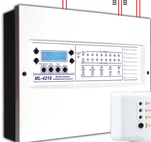
ML-4218 Газовый приемно-контрольный прибор