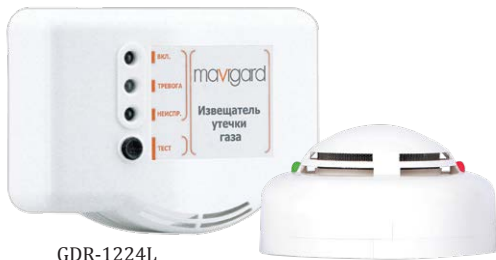
GDR-1224L Mavigard Сжиженный газ, 12/24 В пост. ток, с реле