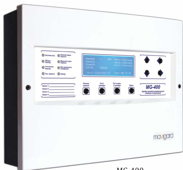
MG-400 Прибор приемно-контрольный газовый, 4 каналный

Mavigard MG-400 - это 4-канальная панель управления газовой сигнализацией рабочего напряжения. На каждый канал можно подключить 1 детектор газа или 20 пожарных извещателей с неограниченным количеством ручных извещателей.