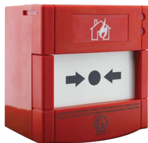
ML-2710.IS Maxlogic Неадресный пожарный ручной извещатель, искробезопасный

Разработан специально для использования в местах с высоким уровнем опасности, где требуется сертификат АTEX, и где важны точность и стабильность работы обнаружения. Устанавливается и используется легко, обладает эргономичной конструкцией. Серия кнопок ML-27X0.IS предпочтительна из-за своей совместимости с всеми конвенциональными системами пожарной сигнализации.