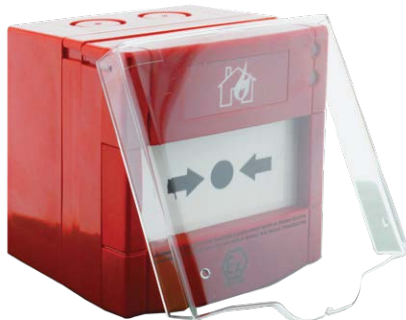
ML-2730.IS Maxlogic Неадресный пожарный ручной извещатель, Погодоустойчивый (IP65), искробезопасный